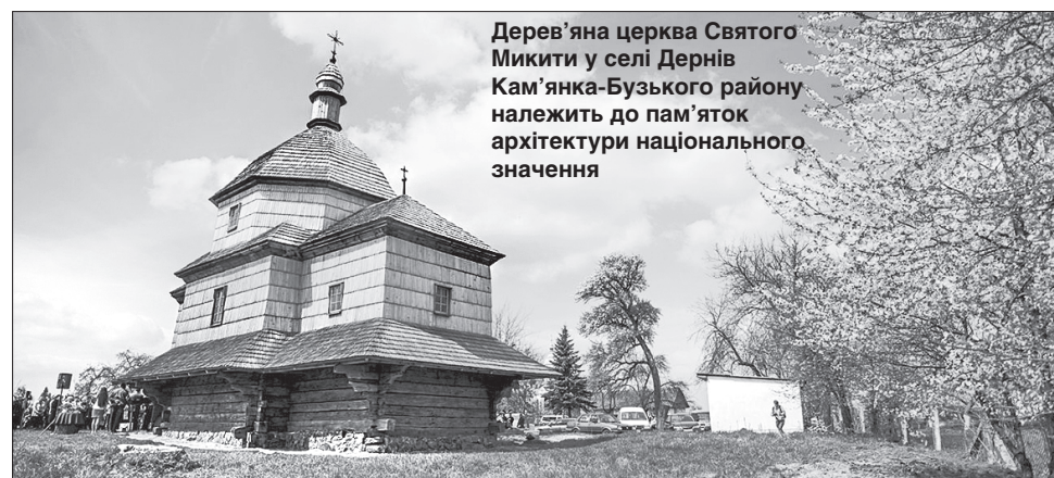
Дерев'яна церква Святого Микити у селі Дернів Кам'янка-Бузького району належить до пам'яток архітектури національного значення

Два роки тому, поінформували в облдержадміністрації, на реставрацію церкви в Дернові надали півмільйона гривень,