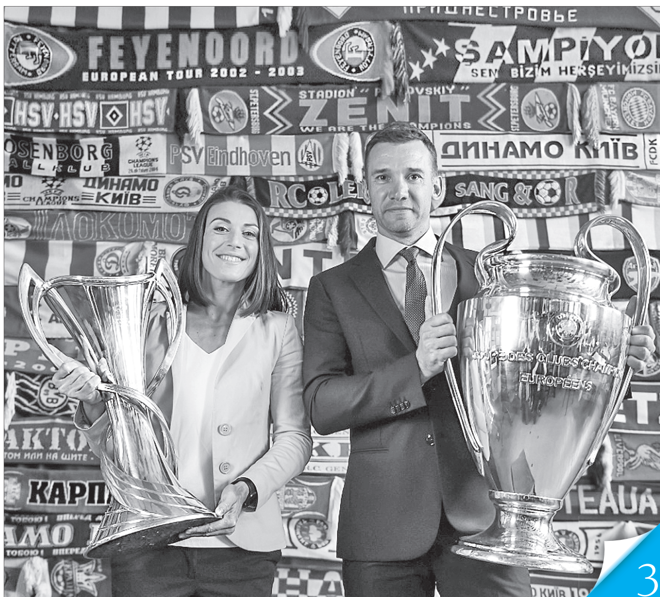
Кубки Ліги чемпіонів УЄФА подорожують з легкої руки амбасадорів Андрія Шевченка та Ілі Андрущак

В ОЧІКУВАННІ ФІНАЛІВ. Наприкінці травня Київ стане столицею європейського клубного футболу