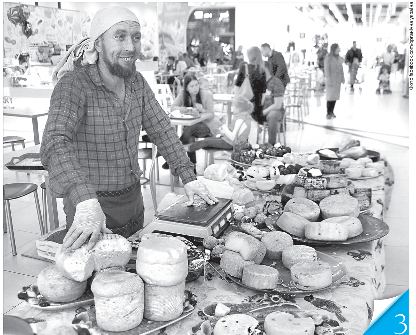
Органічне виробництво — це не просто продукти без хімії та ГМО, а особлива філософія

ІННОВАЦІЇ. Іноземні та вітчизняні спеціалісти довели ефективність курсу на виробництво здорової продукції