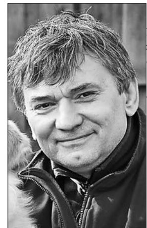
Фільм Ігоря Піддубного «Повернення» отримав Гран-прі V Міжнародного фестивалю історичного кіно

Захід проходить на волонтерських засадах без державного та муніципального фінансування. Організатори запрошують до партнерства всіх не байдужих до історії України та майбутнього української нації, адже просвітницька складова фестивалю історичного кіно не менша, а навіть більша, ніж мистецька.