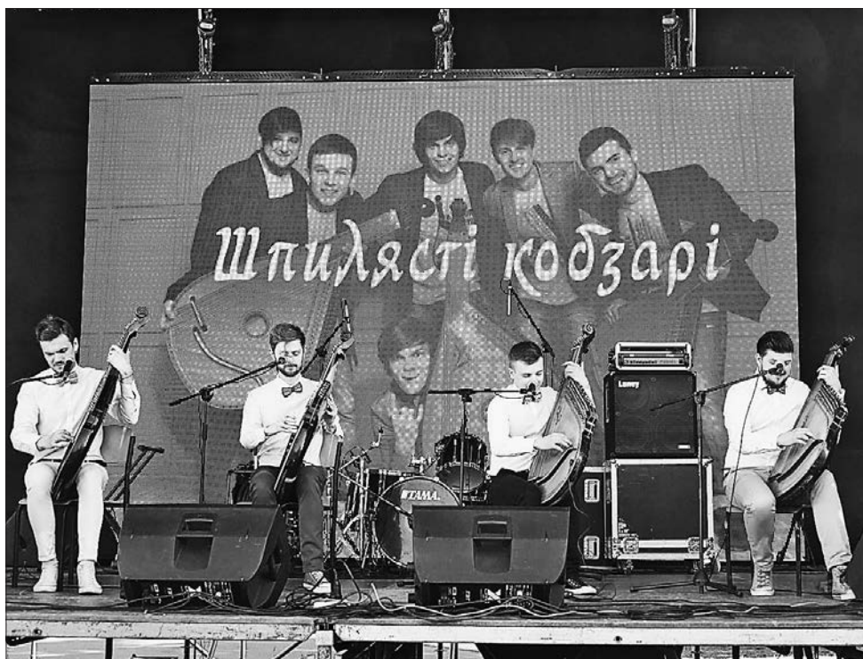
Дуже по-сучасному звучали зі сцени традиційні народні інструменти — бандури

танцювальні колективи з Києва, Харкова та Донеччини. А ще місцевим жителям, які за минулі роки встигли скутити за концертами та іншими творчими подіями, запропонували виступи учасників фестивалю на театральній і музичній сценах, у літературній вітальні, пройшли заходи у локаціях «Живопис», «Наукові пікніки» тощо. Всі охочі також могли долучитися до майстер-класів із декоративно-ужиткового мистецтва майстрів з Авдіївки, Краматорська, Харкова. А для найменших відвідувачів фесту передбачили низку пізнавальних і розважальних ігор.