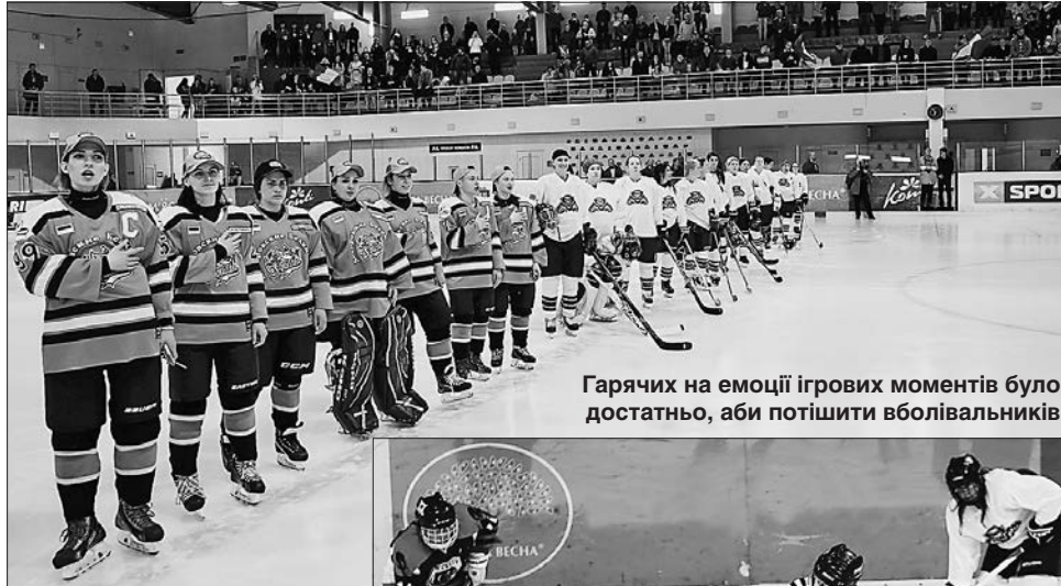
Гарячих на емоції ігрових моментів було достатньо, аби потішити вболівальників

Керівник області, зокрема, зазначила, що розвиток спорту — один із невід'ємних пріоритетів розвитку Харківської області. «Ми розвиваємо як олімпійські, так і неолімпійські ви-