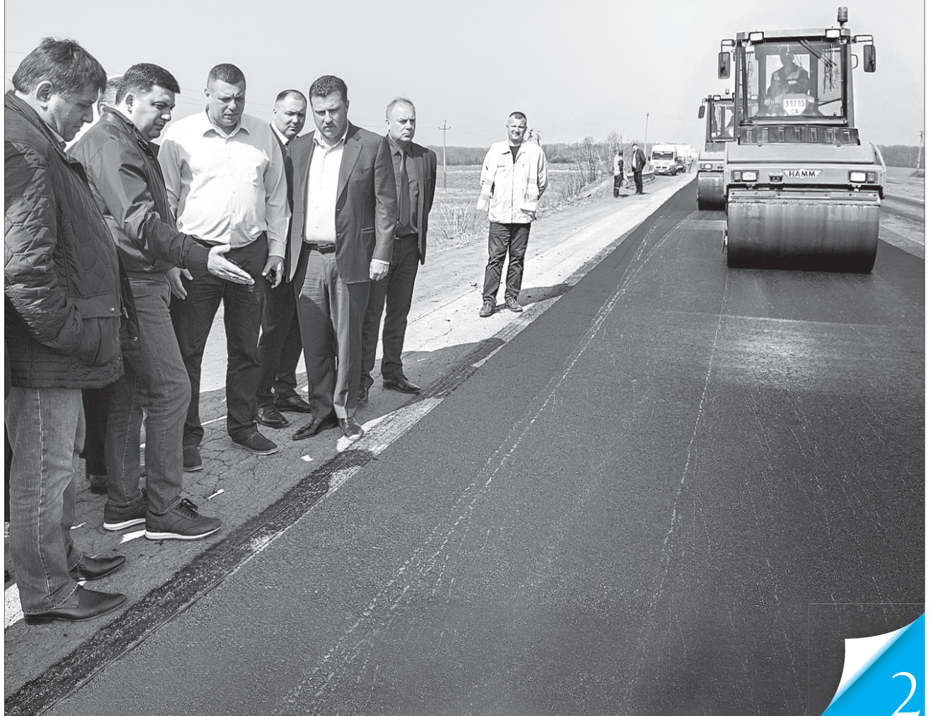
За два роки відремонтовано понад 3000 кілометрів українських доріг