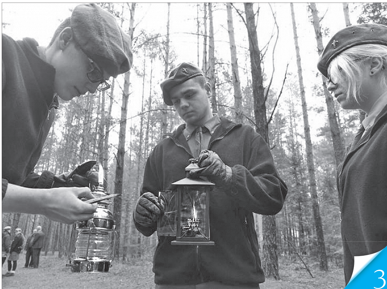
Торік запалений українцями в Костюхнівці Вогонь Незалежності польські молодіжні організації відвезли до Варшави й урочисто передали президенту Польщі

АКТУАЛЬНО. Голова Інституту національної пам'яті Польщі Ярослав Шарек вважає, що підписання угоди з українськими архівами свідчить: є такі сфери, де можна діяти спільно