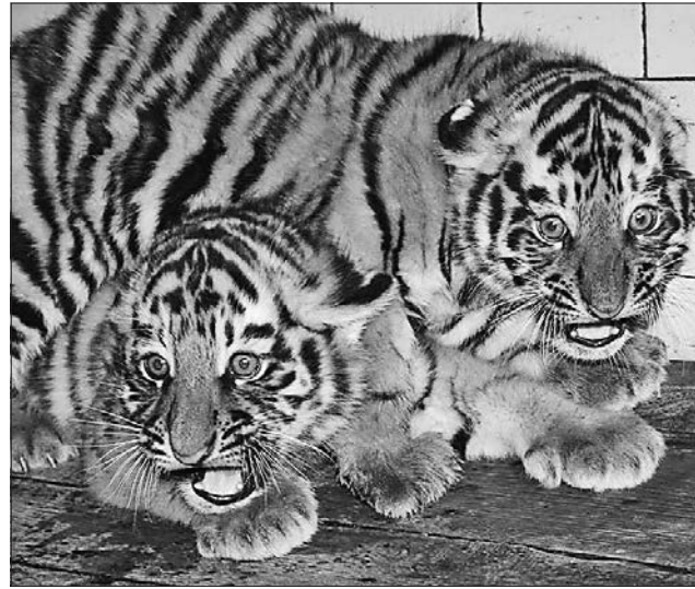
Які ж милі ці пухнасті котики! Щоправда, незабаром вони стануть копіями великих і граційних батьків

Миколаївський зоопарк має найбільшу в Україні колекцію представників диких кішок — від маленького сервала до триметрового амурського тигра, від мешканця зони вічних снігів барса до пустельної рисі каракала. Відвідувачі можуть побачити двійку дитинчат амурського тигра. Найбільш уважні та спостережливі гості помічають маля рідкісного амурського леопарда, за яким пильно наглядає мама на ім'я Єва, що сердито шипить на всіх, хто зацікавиться її малюком. Ще одне новонароджене плямисте маля, яке поки що веде потайний спосіб життя, — дитинча сервала Манефи і Судана.