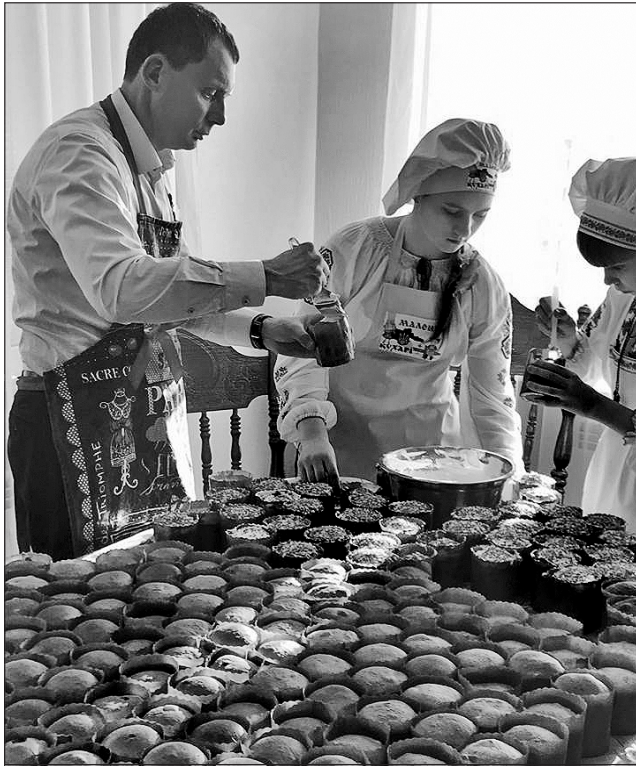
Паски готові до відправлення на передову

Інна ОМЕЛЯНЧУК, Олена ІВАШКО, Микола ШОТ, «Урядовий кур'єр»