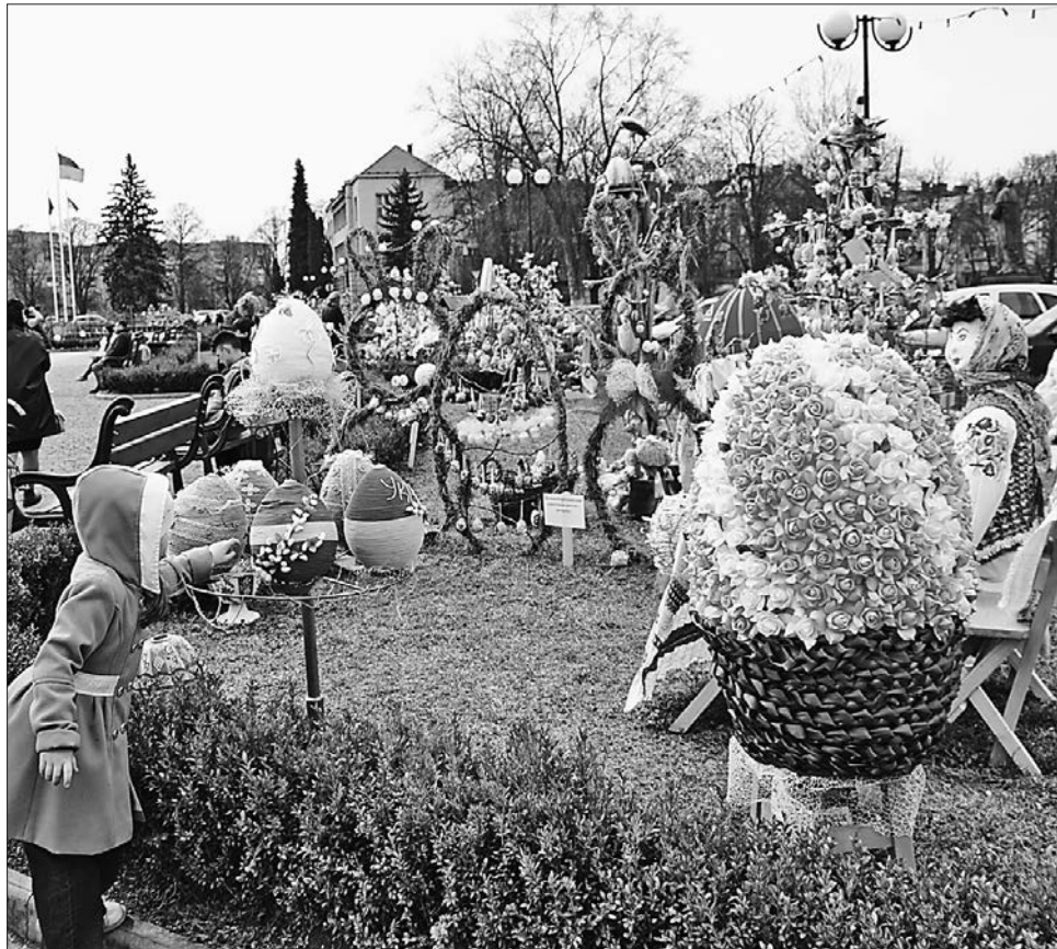
На центральній площі Ужгорода виставили яскраві писанки, зроблені початківцями і досвідченими майстрами

У четвер в атріумі будівлі облдержадміністрації розгорнулася експозиція великодніх рушників, автори яких — освітяни та їхні вихованці. Представили й виставку фотографій на теми Великодня.