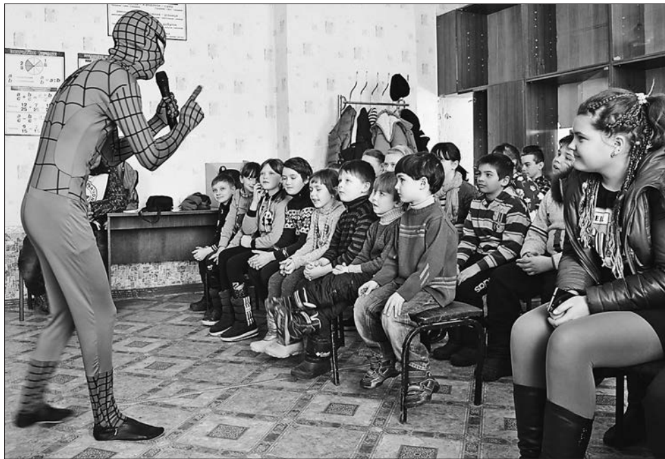
Під час вистави байдужих серед маленьких глядачів не було

«Ми працюємо з цими школами вже більш як три роки, з початку конфлікту. Регулярно проводимо презентації, зустрічі, під час яких розповідаємо вчителям і учням про те, який вигляд мають вибухонебезпечні предмети, як діяти, якщо такий предмет виявлено. Але ця інформація важко сприймається дітьми 6—12 років, тому ми обрали більш прийнятну для них форму подання важливої для збереження їхнього