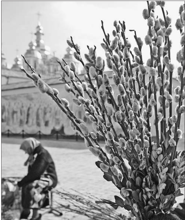
Верба вже прокинулася від зимового сну і налаштує нас на Великодні свята

«На Благовіщення весна зиму перемагає», — каже народне прислів'я. Цього дня не можна братися за жодну роботу. Жінки навіть коси не заплітають. Існує легенда: колись зозуля почала вити на Благовіщення гніздо. За це Гос-