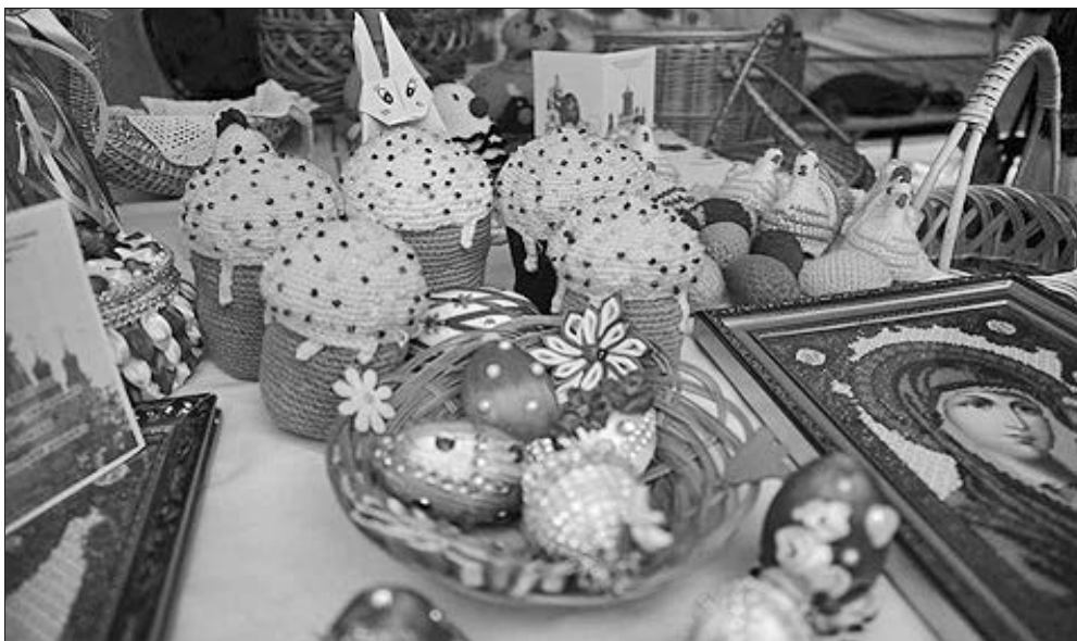
Рукотворні вироби до Великодня допоможуть створити святкову атмосферу