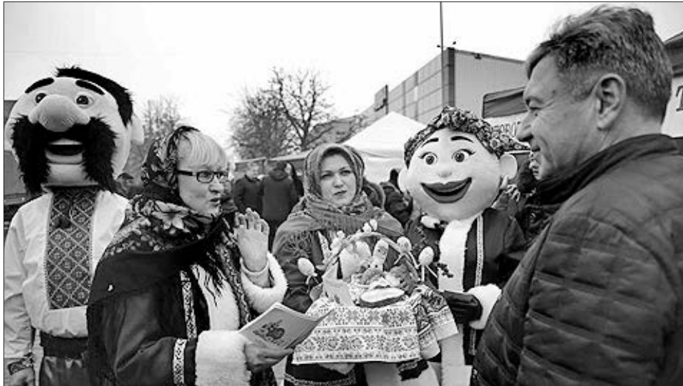
Який же ярмарок без яскравих костюмів і добрих побажань!

Очільник області приділив багато часу спілкуванню з людьми з тимчасово окупованої території біля відділення Ощадбанку та на КПВВ «Станиця Луганська». Говорили переважно про майбутнє мирне життя.