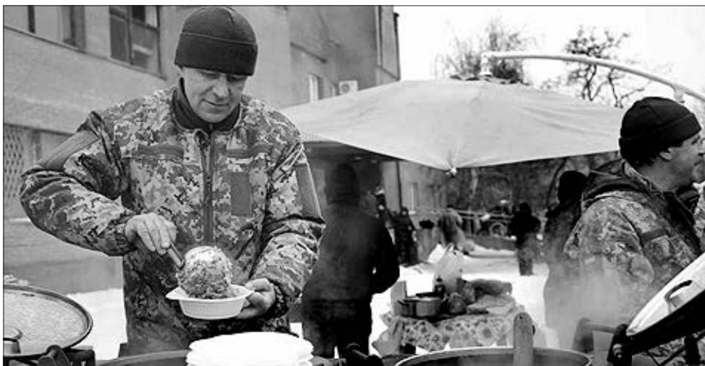
Військові пригощали ярмаркувальників польовою кашею