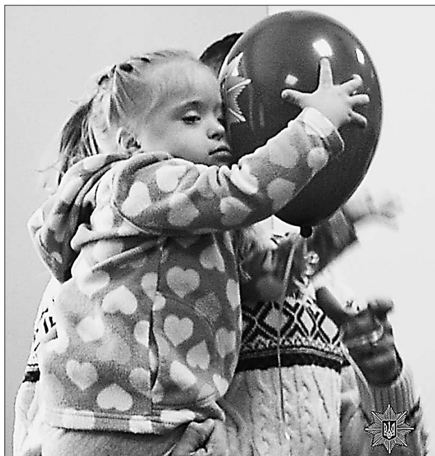
Унікальні малюнки раділи всебічній увазі