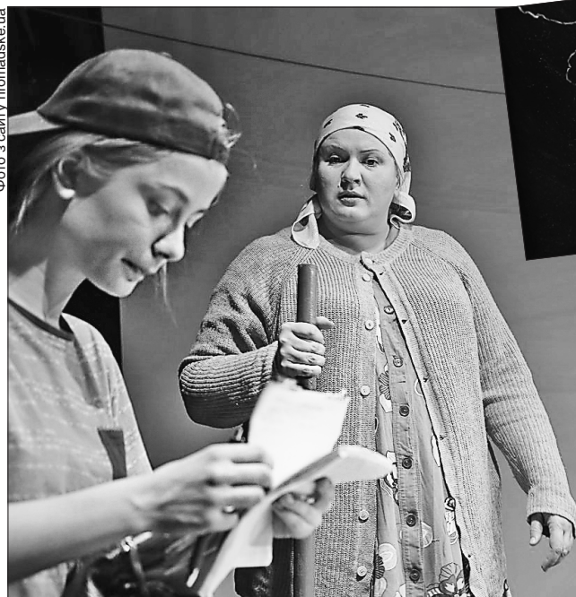
На сцені грали як відомі, так і зовсім молоді актори