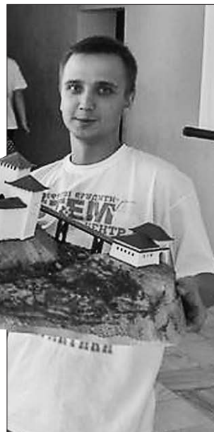
Студенти вже виготовили макети стародавніх твердинь Кременця, Бучача, Язлівця й Терехівлі

3D-моделі, які розробили студенти, планують найближчим часом показати в українській столиці на міжнародній туристичній виставці UITT «Україна — подорожі та туризм», а також під час проведення інвестиційного форуму на Тернопіллі.