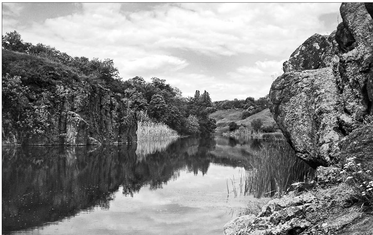
Тясминський каньйон чекає туристів та дослідників