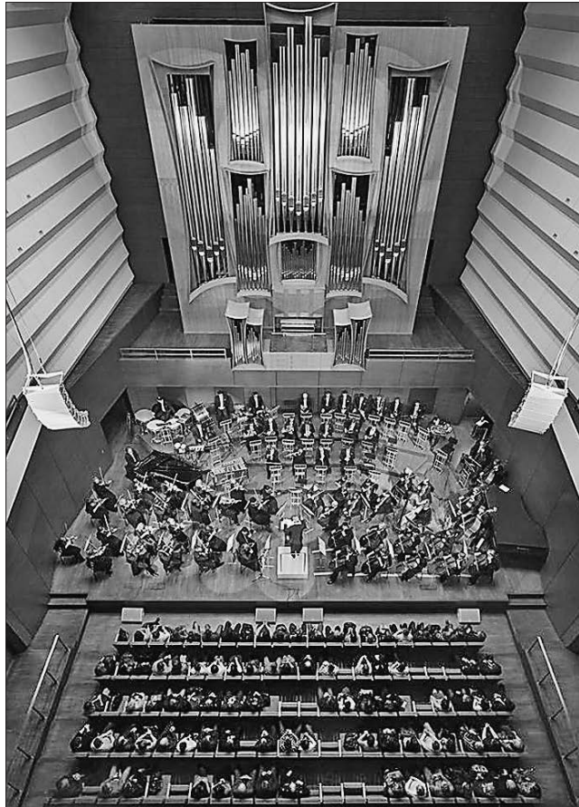
Органний зал Харківської обласної філармонії вже радує харків'ян і гостей міста концертами унікального звучання

На другому пусковому об'єкті, а це зал філармонії, не баченими раніше темпами тривають відновлювальні роботи. Нині тут працюють майже 150 осіб — архітектори, скульптори, будівельники, оздоблювачі. Фахівці розпочали найбільш відповідальну і складну частину роботи — відтворення унікальної гіпсової ліпнини у старовинній