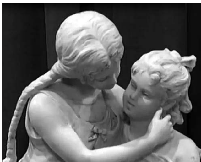
Порцелянову скульптуру роботи німецького майстра Августа Шпіса «Сестри» для широкого огляду виставлено вперше