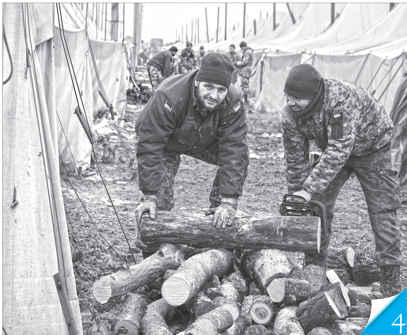
Бійці сподіваються, що у них дров буде вдосталь!

АРМІЯ. На Миколаївському загальновійськовому полігоні намагаються створити належні умови для бійців