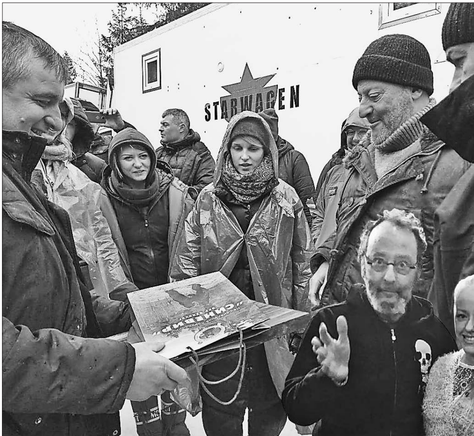
Французький актор у захваті від Українських Карпат та обіцяє селфі по завершенні роботи