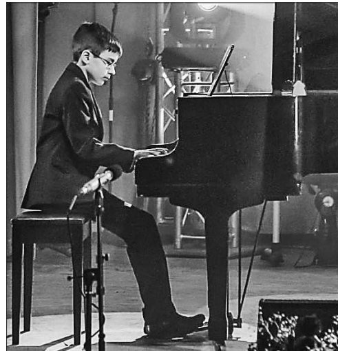
Майбутні Станковичі починаються з таких конкурсів