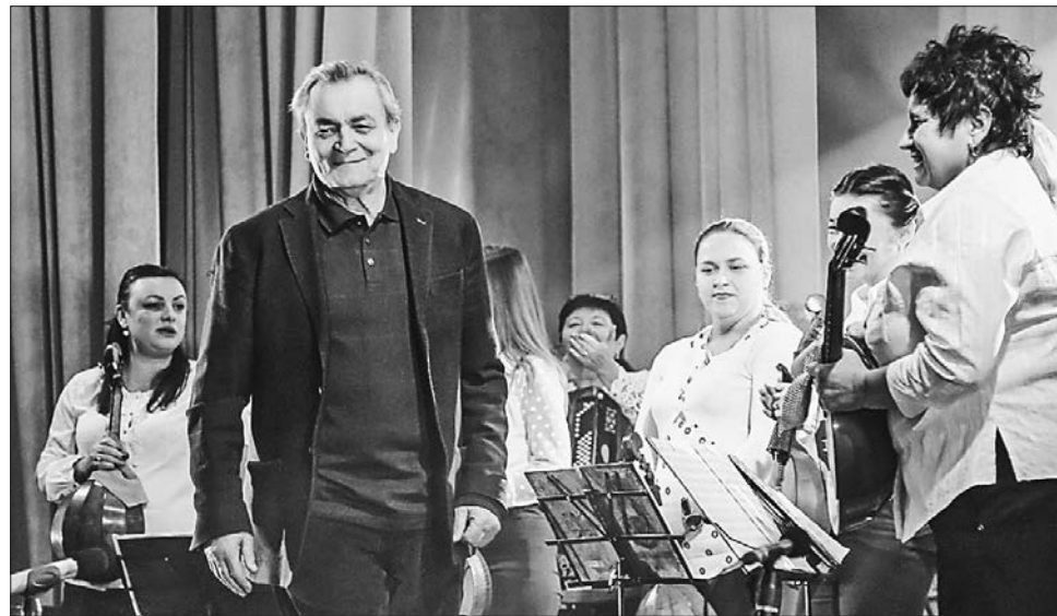
Маєстро радо зустрічав митців на рідній землі