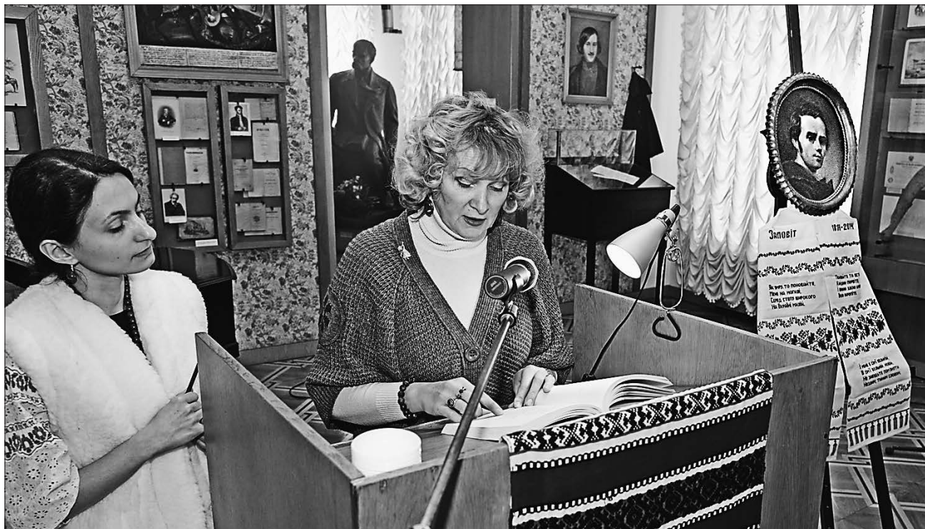
У музеї Тараса Шевченка читали вірші ушлявлено поета

ДО ДНЯ НАРОДЖЕННЯ. В інтернеті й на вулицях цими днями лунають вірші Кобзаря