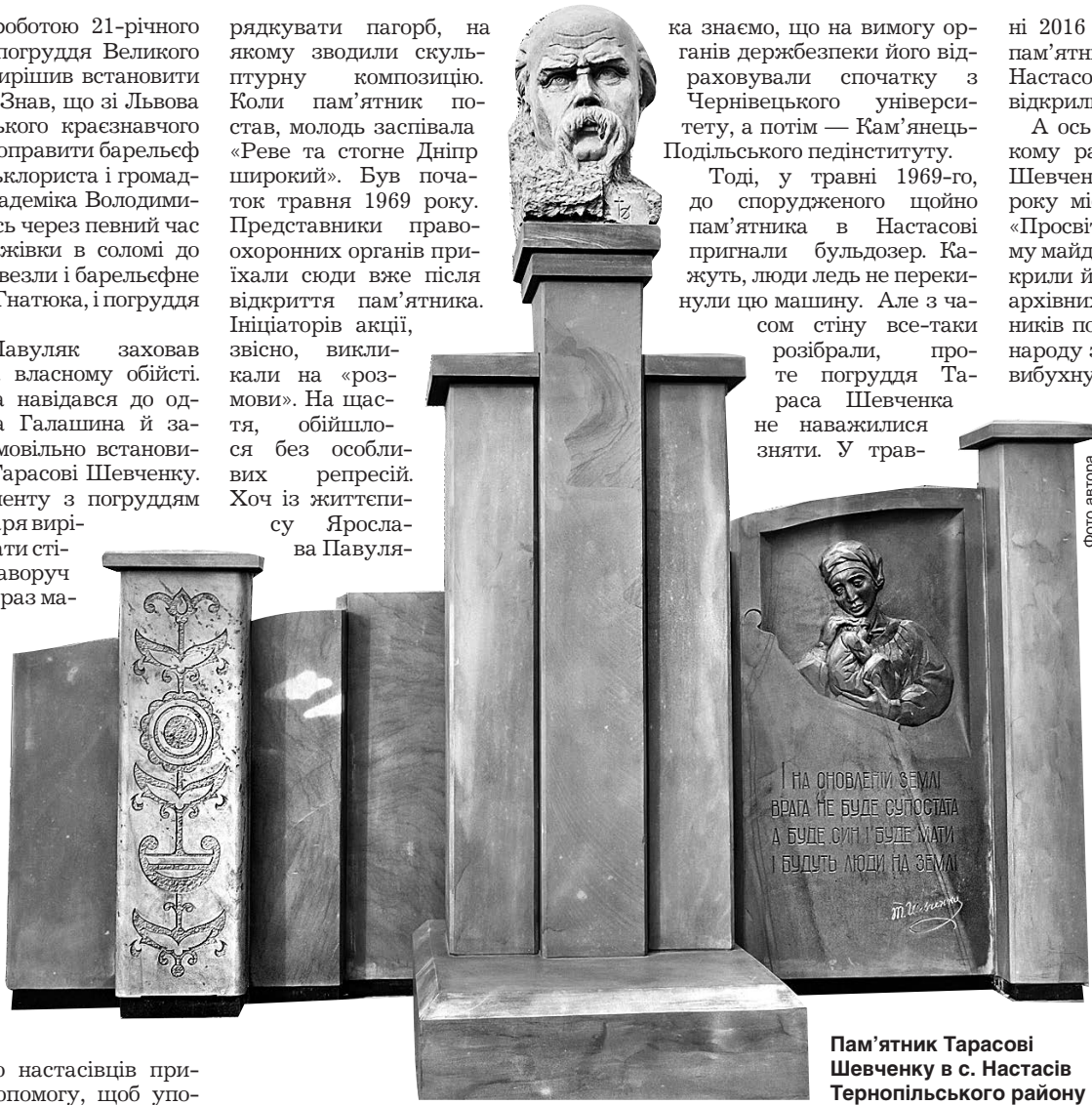
Пам'ятник Тарасові Шевченку в с. Настасів Тернопільського району

Відновили скульптуру 1926 року на старому місці серед двох ялин. Та недовго судилося стояти тут погруддя. У вересні 1930-го польська влада розпочала пацифікацію — репресивну акцію проти українців Галичини і Волині. Під час такого умиротворення й було вщент знищено в Лозівці пам'ятник Кобзарю. А ось утретє встановити його селяни змогли аж у липні 1960 року. На урочистостях побував Дмитро Павличко. Він навіть відгукнувся на захід віршем. «В селі Лозівці це було, розвіяв вітер, як соломі, всіх ворогів. Стоїть село і пам'ятник Шевченку в ньому».