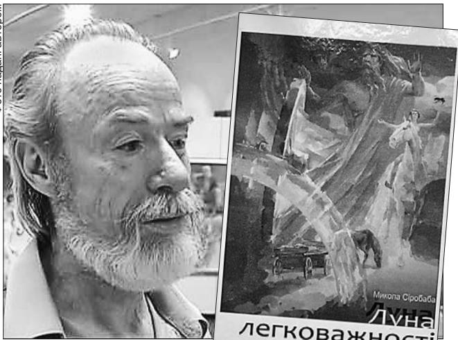
Лірика Миколи Сіробаби ліне просто з душі про наболілі проблеми Донбасу