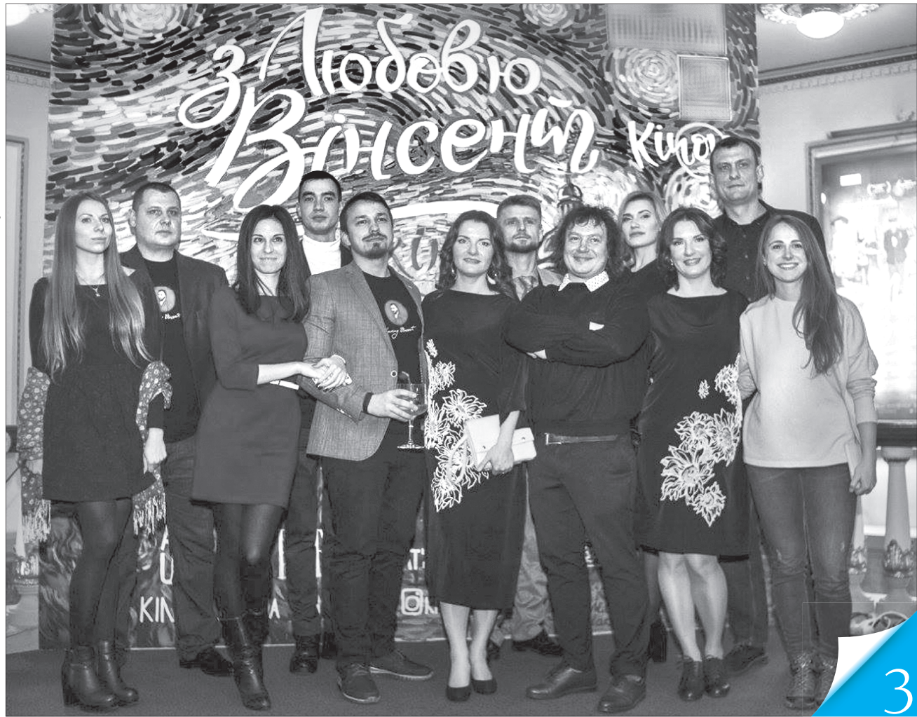
Українська команда художників, яка оживила шедеври Вінсента ван Гога

МОЛОДЦІ! Українці взяли участь у створенні анімаційного фільму «З любов'ю, Вінсент», який став номінантом на найпрестижнішу світову кінопремію