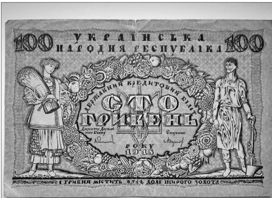
100 гривень Української Народної Республіки (експонат острозького музею нумізматики)

Батьком гривні в незалежній Україні став Віктор Ющенко: вона з'явилася в обігу 1996-го, через 5 років після народження незалежної держави.