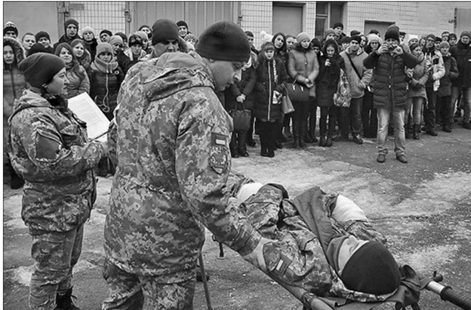
Під час практичних занять майбутніх медиків навчали стабілізувати стан пораненого

Військові медики показали, як організують роботу групи посилення військової лан-