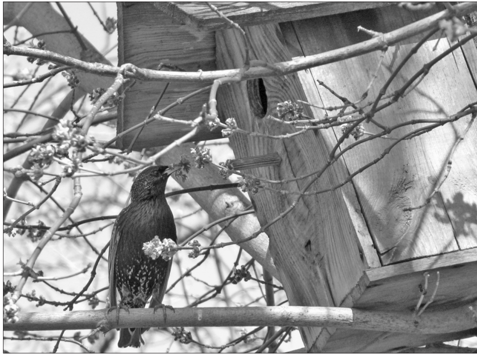
Повернення перелітних птахів — одна з ознак, що весна остаточно перемогла

За старим стилем на Явдохи Плющихи починалася календарна весна. До XV століття наші прадіди відзначали цього дня новорічне свято. Найкращим провісником теплої весни був приліт ластівок. Гніздечко цієї пташини у сільському обійсті досі вважається оберегом. Зруйнувати його — великий гріх і накликає бід на господарство. Цього дня цілющі властивості має тала вода. Нею слід умитися вранці, напийтися всім членам сім'ї, напоїти худобу і птицю. На Явдохи жінки замовляють пороги: кладуть під ноги гілочку полину, чебрецю, нагідок. Ці лікарські рослини захищають помешкання від зовнішніх негараздів і хвороб. На порози стояти не можна — застоїш добробут, що йде в хату. Через поріг нічого не передають — це межа, що роз'єднує людей. Якщо кури водички нап'ються на Яв-