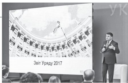
Звіт Уряду 2017

2 Прем'єр-міністр Володимир Гройсман прогнозує середню щорічну платню в Україні на рівні 10 тисяч гривень