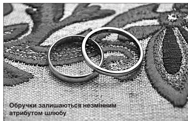
Обручки залишаються незмінним атрибутом шлюбу

Працівники ДРАЦСів, які брали участь у заході Мін'юсту, прикрасили приміщення святковою атрибутикою, забезпечили роботу фотозон, запросили рок-гурт, який вітав молодят у Черкасах, а для уманців — колектив Центру культури і дозвілля райдержадміністрації.