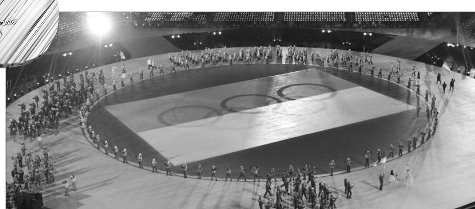
Український прапор на церемонії відкриття Зимових Ігор-2018 несли олімпійська чемпіонка капітан жіночої збірної з біатлону Олена Підгрушна

Попри сім годин різниці в часі між Сеулом та Києвом, українські вболівальни-