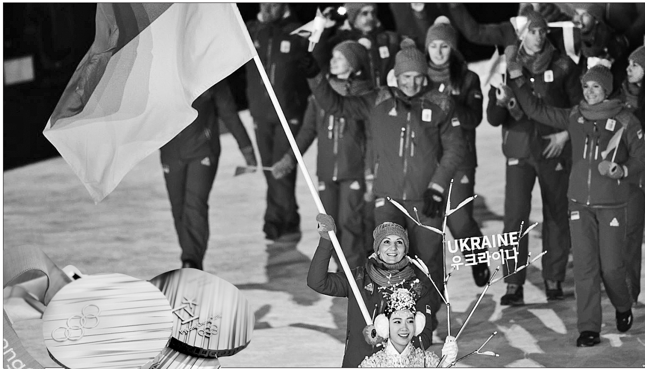
Ганна РОМАШКО для «Урядового кур'єра»

ОБ'ЄДНАВЧА ПРИСТРАСТЬ. 9 лютого в чаші 35-тисячного стадіону південнокорейського міста Пхьончхан запалав вогонь XXIII зимових Олімпійських ігор