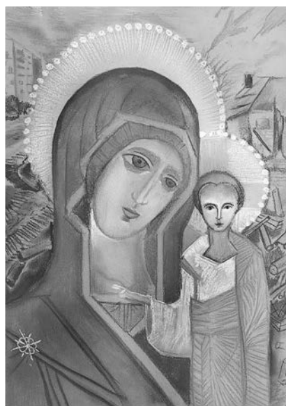
Відзначена робота художниці