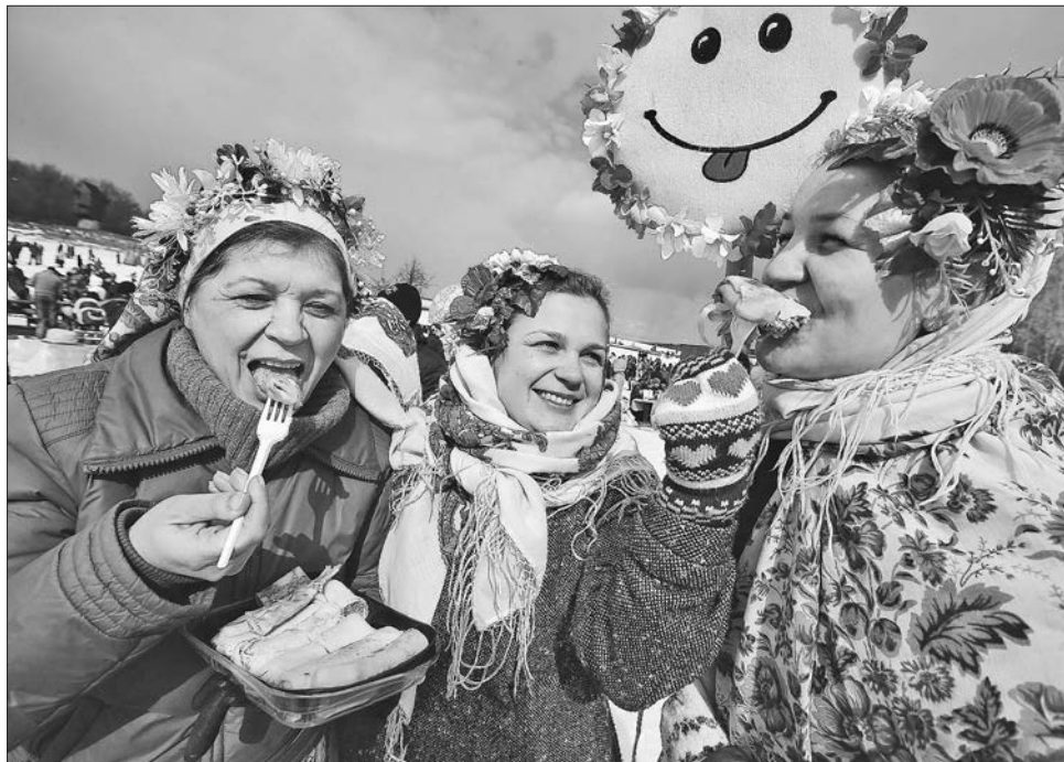
Масницю, або Колодія, здавна вважали жіночим святом

Головне релігійне свя- то у лютому — Стрітен- ня Господне. Його правд- ні назви — Зимобор, Гром- ниці. До наших часів збе- реглося народне прислів'я: «Минули Громниці — про- щайте, вечорниці». За давнім повір'ям, на соро- ковий день після Різдва Христового зима зустрін- ється з весною. Парафіяні освячують у храмах воду