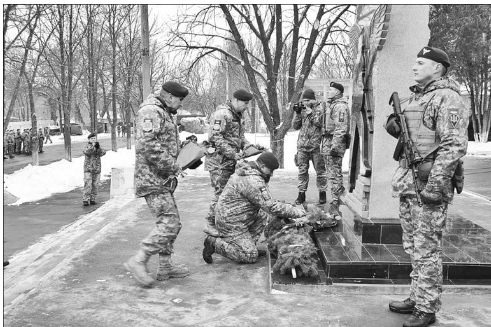
Біля пам'ятного знака складатимуть присягу майбутні захисники України

на виконання бойових завдань. Цей знак стане ще одним нагадуванням про мужність і героїзм українських бійців проти загарбників, які прийшли до України з війною.