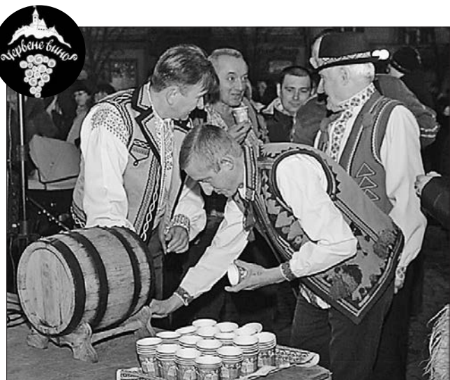
Кращі винороби Закарпаття пропонують спробувати свої вина

На відкритті зазначали, що цей фестиваль найстаріший серед тих, котрі народилися