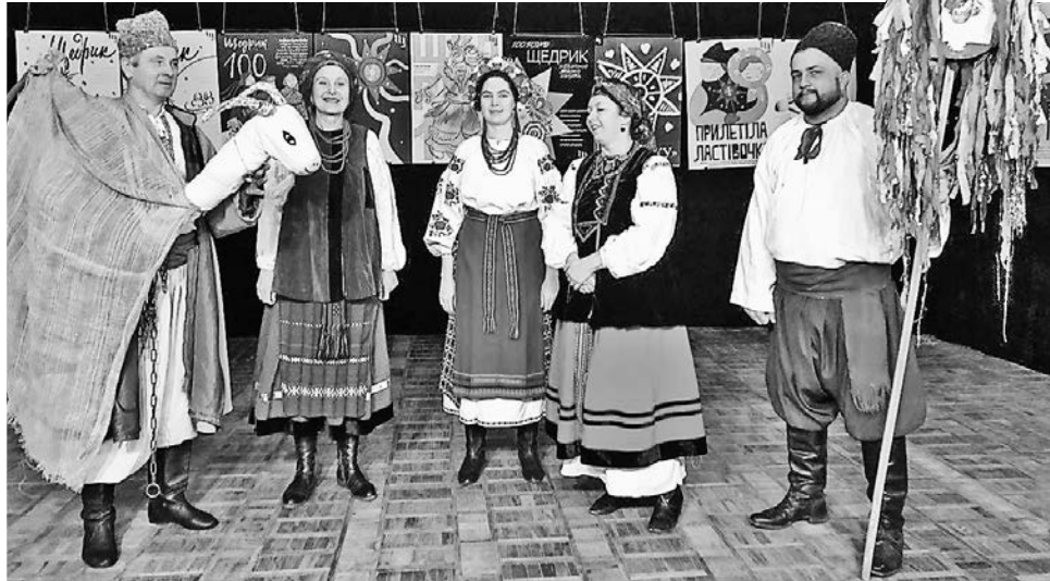
Учасники вертеп-фесту-2018 бажають щастя всім харків'янам

Фестиваль відбувається під об'єднаними гаслами «Від Харкова до Карпати Україна рідна мати!», «Схід і захід разом. Різдво єднає нас!» Головним заходом першого дня фестивалю став парад вертепів, який пройшов в обласному центрі на вулиці Сумській. Його учасники зібралися на майдані Конституції та пройшли святковою хо-