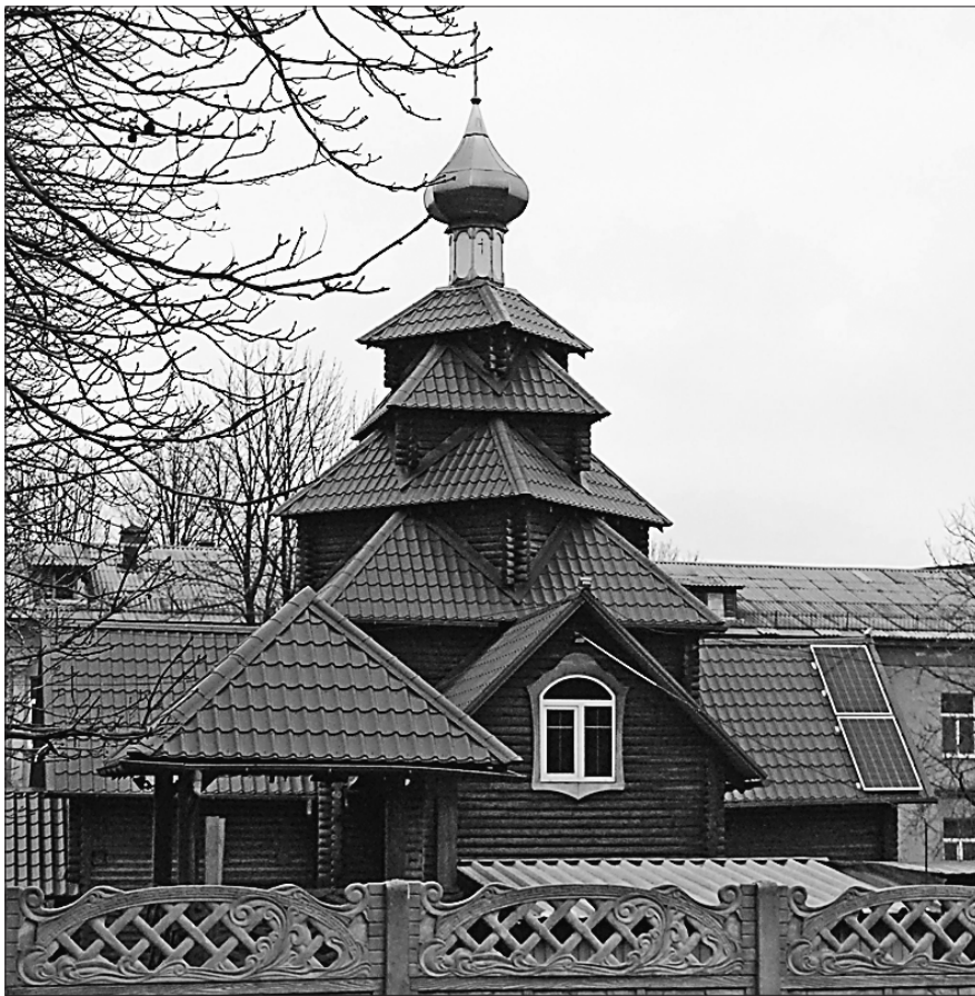
Церква у Кам'янському працює на сонячних батареях