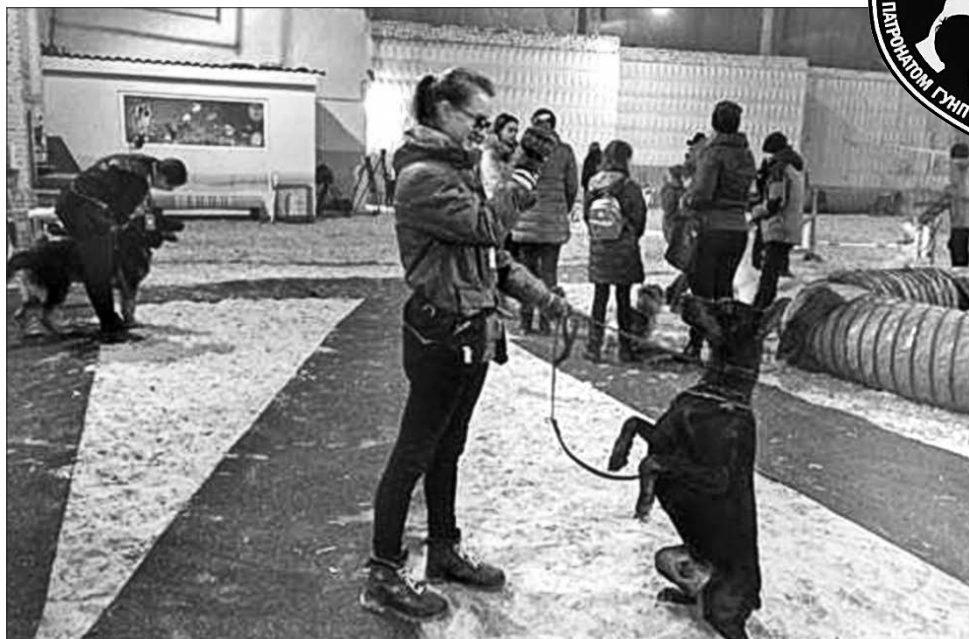
На навчання у клубі юних кінологів діти можуть приходити зі своїми чотирилапими вихованцями, аби навчити їх азів служби