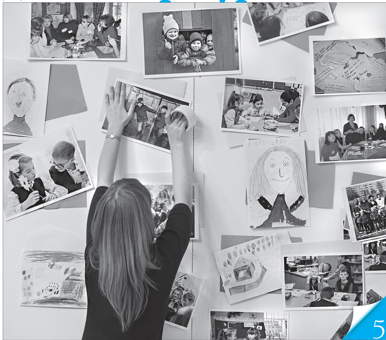
І діти, й дорослі мріють про якісні зміни в освіті

РЕФОРМА. У 2018 році новації, запроваджені профільним міністерством, відчує кожен українець