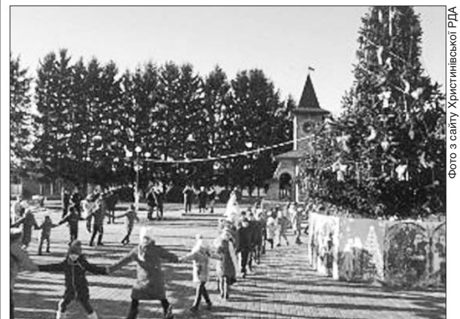
Новорічні гуляння на оновленій площі в Христинівці

Так само урочисто відзначили відкриття реконструйованої центральної площі імені Героїв Майдану жителі Монастирища. Після повної реконструкції цей майдан став справжньою окрасою міста. Тут оновлено тротуари, встановлено фонтан зі скульптурами слонів, карусель зі світловим та музичним супроводом, пам'ятник Іванові Богуну та вхідну арку до паркової зони.