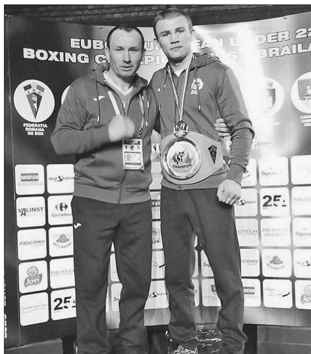
Олександрів Хижняку-старшому й Олександрів Хижняку-молодшому торік було чим пишатися

Днями лауреатів традиційного конкурсу «Підсумки спортивного року» визначила Асоціація спортивних журналістів України. «Найрізноманітніших думок і пропозицій (від місцевих спортсменів, тренерів, команд до добре відомих в Україні та світі атлетів, наставників колективів), як завжди, було більш ніж достатньо. Підбивати підсумки нам було цікаво, а іноді й неочікувано», — зазначається у прес-релізі АСЖУ.