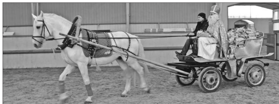
Миколай теж приїхав на коні і з повною каретою подарунків

— Півтора року служив на передовій на блок-постах, виконав свій обов'язок перед Україною, — каже учасник бойових дій тракторист-механізатор з історичного Дерманя, малої батьківщини