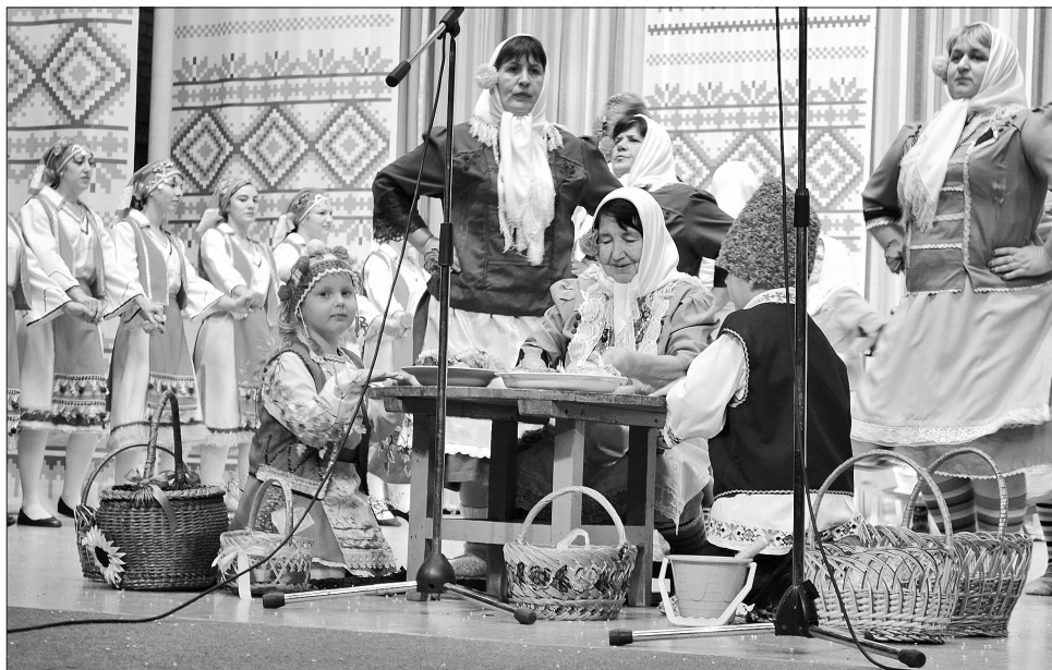
Учасники фестивалю довели: народна творчість захоплює різні покоління