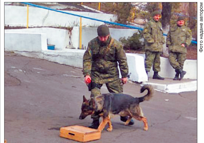
Собака не тільки друг людини, а й добрий помічник у захисті Батьківщини

Як уточнили у кінологічному центрі Національної поліції Донецчини, тут несуть службу 12 добре навчених і підготовлених псів, здатних виконувати складні завдання з пошуку людей, затримання злочинців, виявлення заборонених речовин. Їхній внесок у спільну справу переоцінити важко: з початку року завдяки чотириланним помічникам правоохоронців вилучили з незаконного обігу 18 одиниць вогнепальної зброї, понад 4 тисячі боєприпасів, 149 вибухових пристроїв та 20 кілограмів вибухівки, а також 12 кілограмів наркотиків.