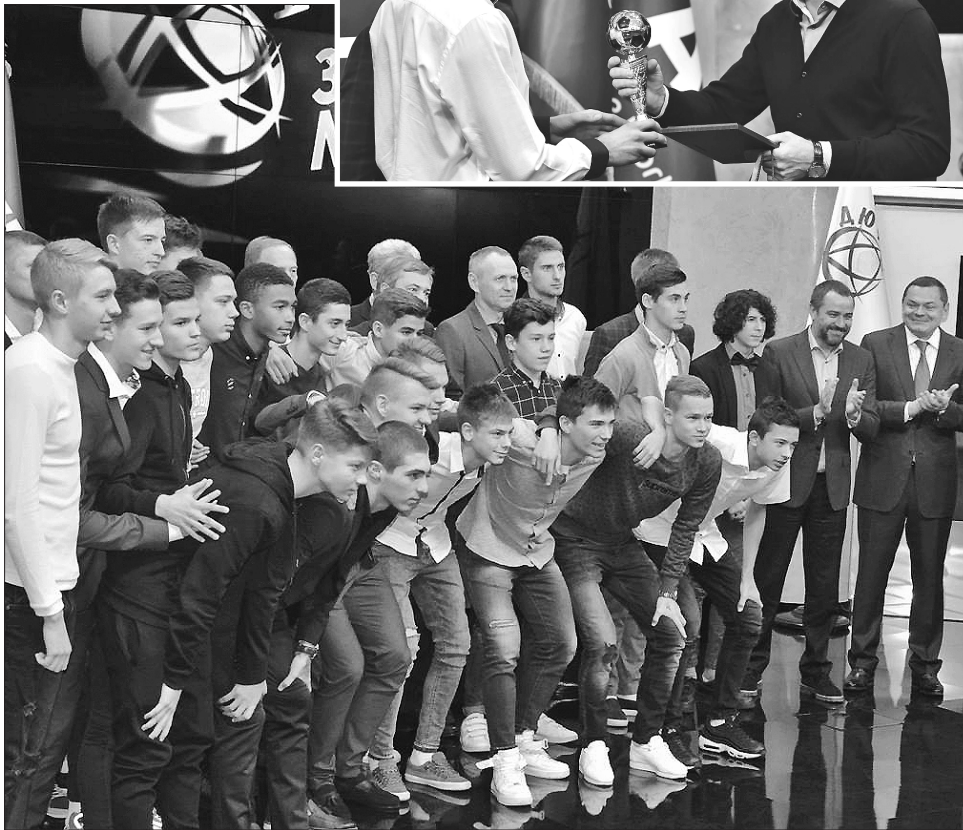
У футбольній піраміді міцна основа