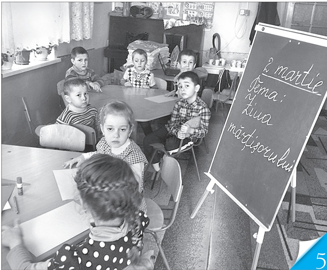
У селі Дяківці на Буковині найменші представники нацменшини здобувають освіту рідною мовою