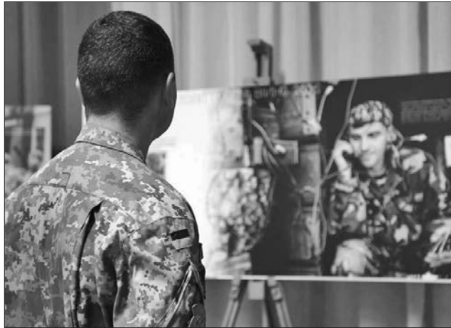
Герої минулої і нинішньої війн українців за власну державність вражають однаковою щирістю і вірою у високу мету