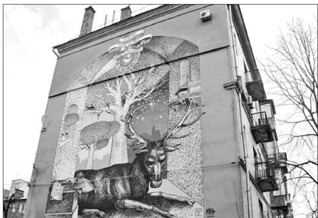
Новий мурал — загадка і символ водночас

На картині, яку розмістили на будівлі на вулиці Пушкінській, зображено оленя, що лежить під Деревом життя. Ця тварина — символ, який асоціюється із сонцем, сходом, чистотою, відродженням, творенням і духовністю. Образ оленя пов'язаний з деревом через схожість його рогів з гілками. Вище написано слова німецького художника родом з Нюрнберга Альбрехта Дюрера, графічна спадщина якого — одна з найбільших в історії європейського мистецтва і за обсягом та значенням стоїть в одному ряду з графікою Леонардо да Вінчі й Рембрандта: «Немає ключів від щастя. Двері завжди відчинено».