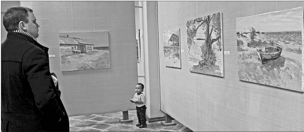
Кожна картина відтворює реальний та містичний Кінбурн

ВЕРНІСАЖ. Митці показали свої твори за результатами пленеру