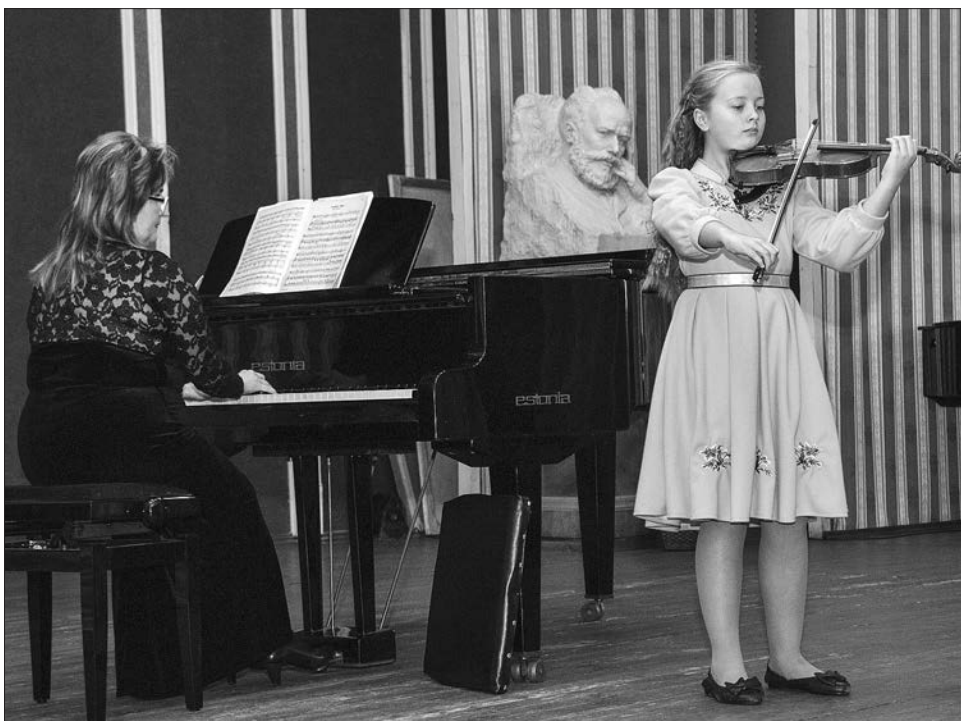
Організатори конкурсу сподіваються, що він стане для дітей дорогою у музичні світи

Учасники конкурсу зустрілися в історичному музеї з май-