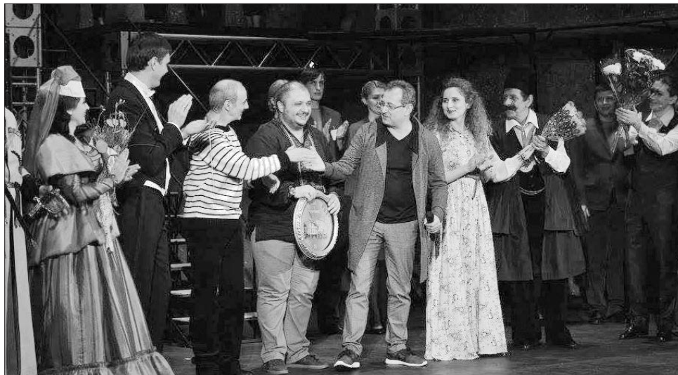
Запрошувати колег із театрів інших країн для спільних постановок уже стало традицією в Національній опереті