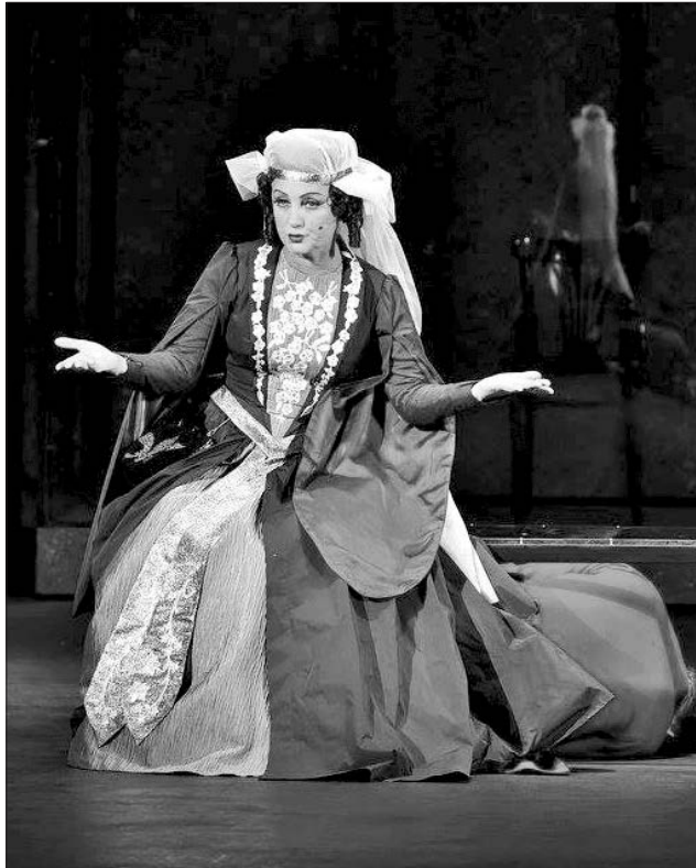
Виставу вирізняють колоритні жіночі персонажі, зокрема Текле — сестри князя

До речі, відповідаючи на моє запитання про стан оперети у Грузії, Іраклі Гогія повідомив, що як такого театру оперети в Грузії вже немає. Є музично-драматичний театр — без оркестру, без хору. Сподіваюсь, що так далеко на шляху оптимізації витрат у культурі ми не зайдемо, а хор та оркестр Національної оперети й надалі радуватимуть українців.