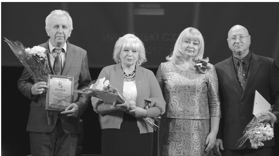
Усі нагороджені — відомі на Сумщині майстри своєї справи

Деяких представників галузі удостоєно різних нагород та відзнак, визначено переможців у дев'яти номінаціях, серед яких «Гордість куль-