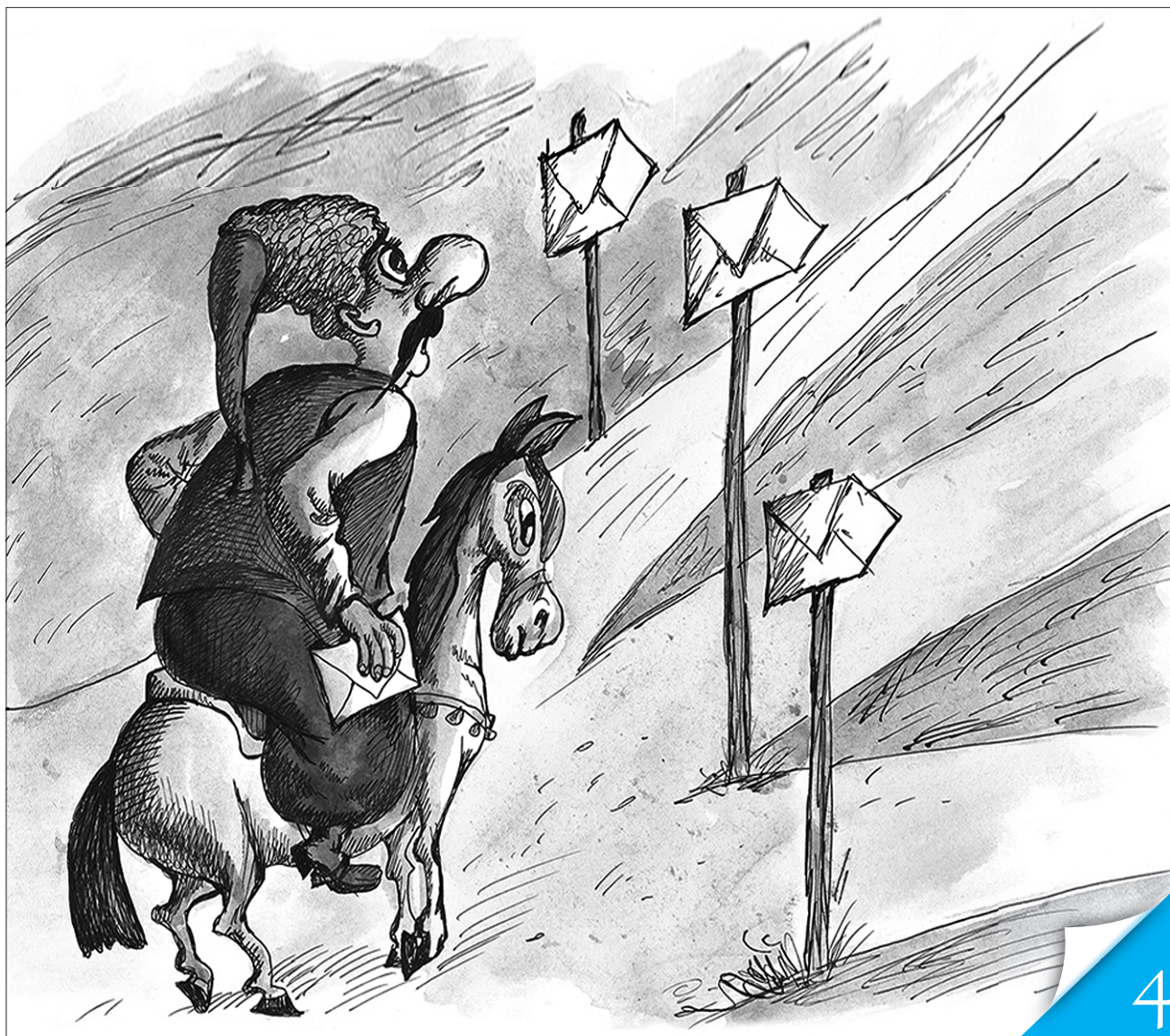
Малюнок Георгія МАЙОРЕНКА з сайту cartoon.org.ua