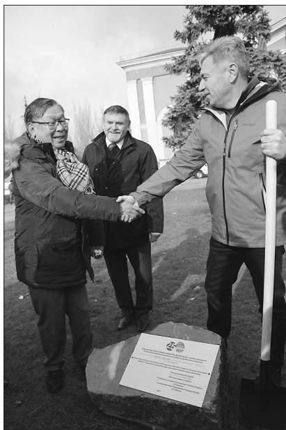
Молоді дерева символізують об'єднання між Луганщиною та Японією

В Україні в межах Року Японії за рішенням президентів двох країн буде висаджено 2500 сакур. Уже вкоренилися 760 дерев. Северодонецьк відкрив четвертий десяток українських міст, де тепер чекатимуть на прекрасне цвітіння навесні.