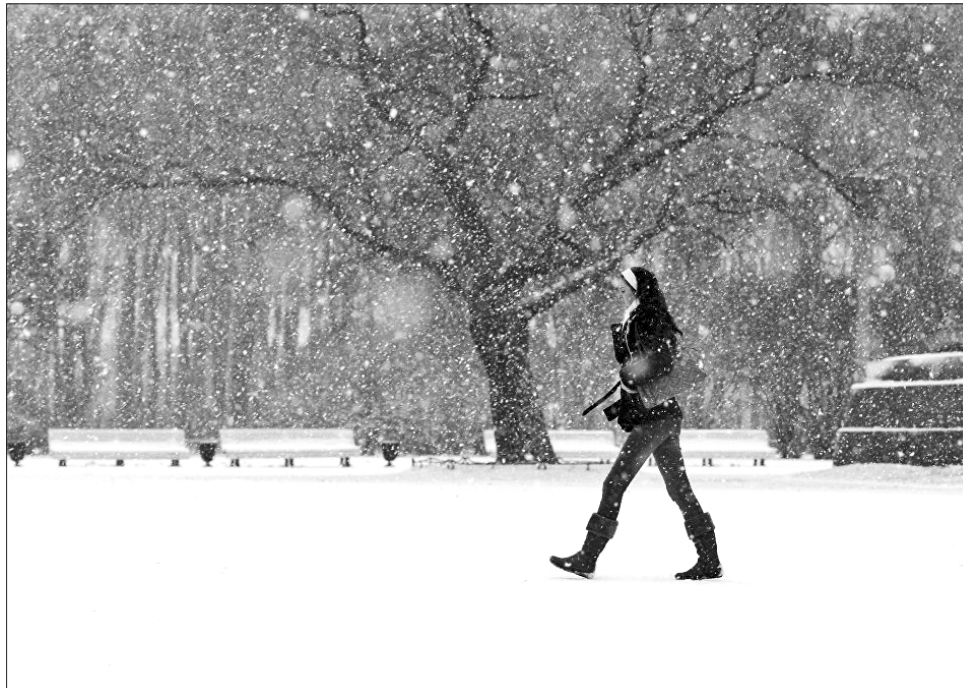
Білі мухи — одна з наочних ознак того, що попереду пора чудова, та холодна

Параскева П'ятниця вважається покровителькою жінок. Цього дня їм не можна шити, ткати, працювати на го-