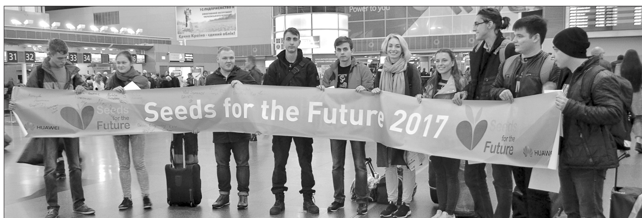
Сьогодні — студенти, завтра — лідери у сфері інформаційно-комунікаційних технологій