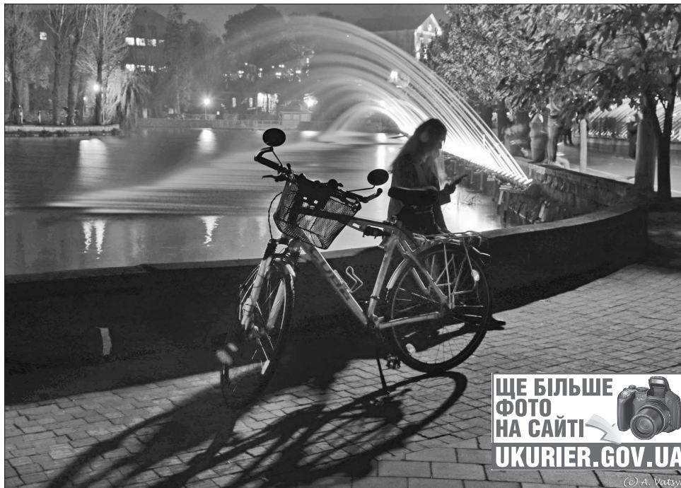
Увечері тернополяни та гості міста квапляться помилуватися барвами аераційного водограю

Леонід Бицюра, заступник міського голови, каже, що всім потужних насосів пропускають через гідросистему 1000 кубів води за годину. З одного боку фонтан тягнеться на 120 метрів, з іншого — на 122. Водограй має 404 форсунки, які дають струмінь води завдовжки 9 метрів і заввишки майже 4. На введення першої черги