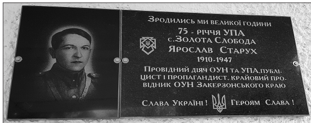
Меморіальна дошка на честь провідного діяча ОУН та УПА Ярослава Старуха, яку відкрили в Золотій Слободі Козівського району

Ольга Ромілович мала лише 18 років. Та її серце було сповнене любов'ю до України, тож вона стала у лави повстанців. 23 травня 1944 року під час прориву куреня «Бистрого» на Волинь дівчина загинула біля хутора Коршемки. Але її жер-