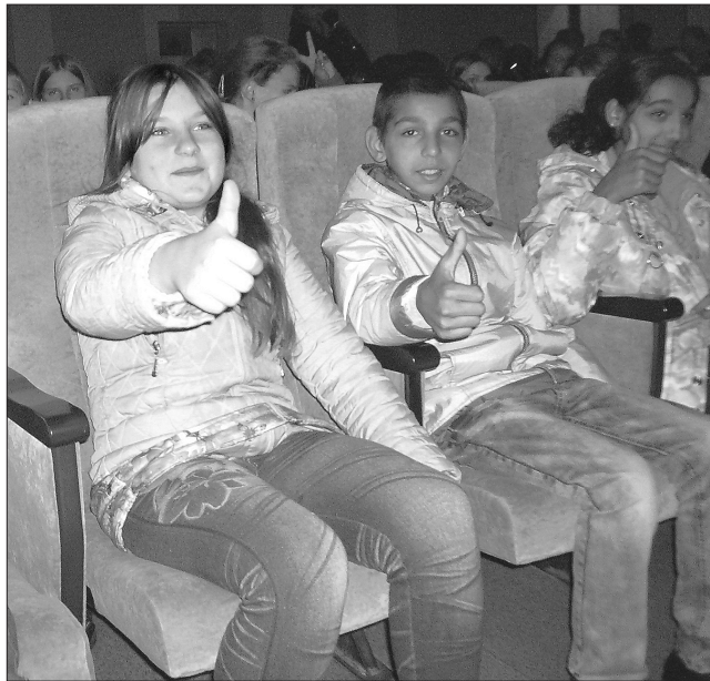
Дітям Северодонецька дуже сподобалася презентація нового проекту «Казкова скриня»

Презентація проекту перетворилася на справжнє свято. Весело й радісно було не лише тим дітям, котрі наважилися взяти участь у конкурсах проекту й отримали нагороди, а всім, бо кольоровий мікс із танців та привітань, ігор та урив-