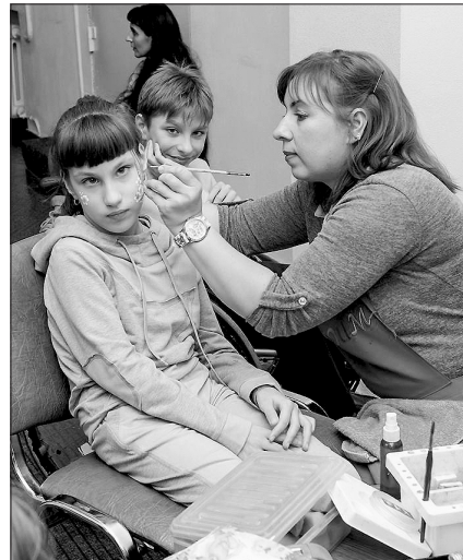
Охочі спробували себе як моделі