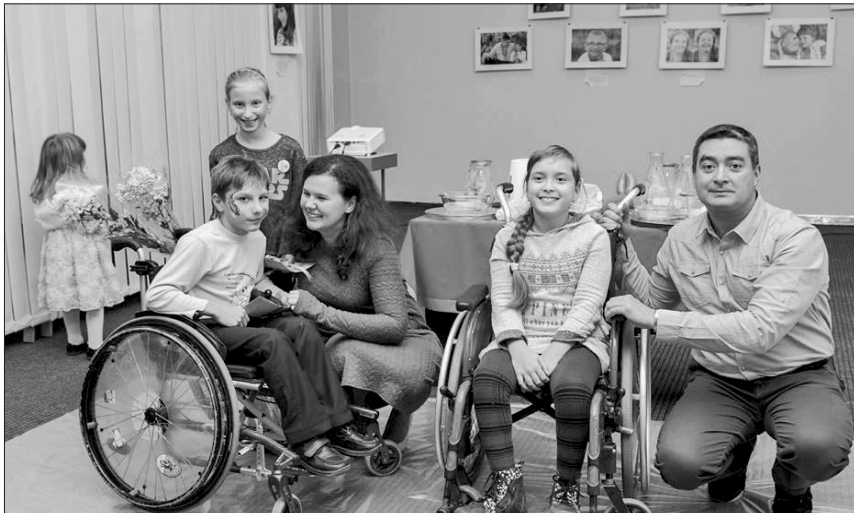
Задоволені і діти, й дорослі

СОЦІАЛЬНИЙ ПРОЕКТ. У Миколаєві відкрили фотовиставку про особливих дітей