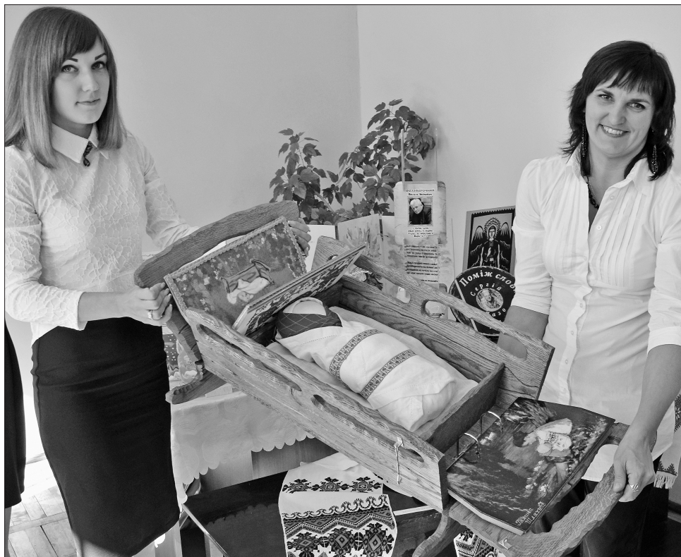
Ось такий артбук «Колисав мою колицку вітер рідного Поділля» представили працівники тернопільської бібліотеки для дорослих №4

«Музей у валізі», цього разу присвятила його 145-річчю із дня народження Богдана Лепкого.