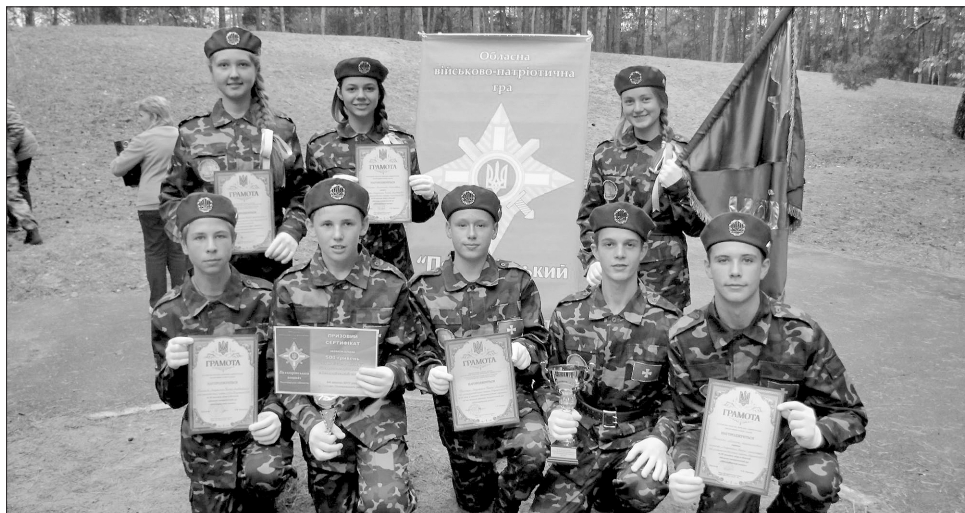
Команда «Засульська чайка» — яскравий представник сучасного українського лицарства

— Гру названо ім'ям Симона Петлюри, отже запитання блиц-вікторини стосувалися його біографії та особливих заслуг. Під час реалізації програми патріотичного вихо-