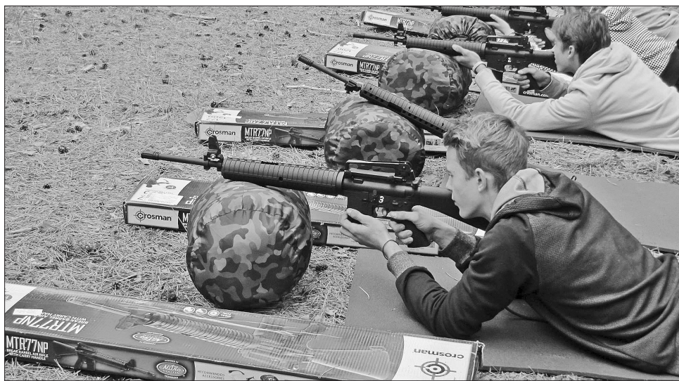
Справжній козак має влучно стріляти і «реп'яхом» на коні сидіти...